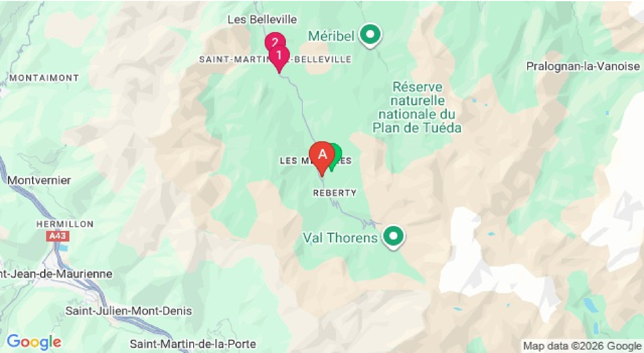
Map data ©2026 Google